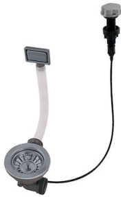
Desagüe automático Gun metal - PG