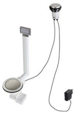
Desagüe automático Space Light - PL