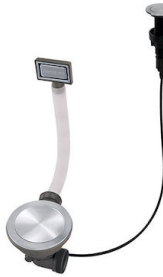
Desagüe automático Space Push - PP