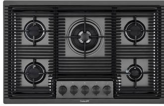
Placa de cocción Milanello Gun Metal 5F