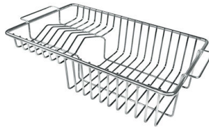
Cesta portaplatos inox 8100 201