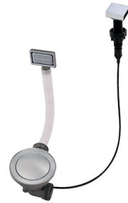
Desagüe automático Space - PA