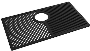
Griglia Black 8100 653