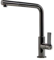
Monomando Omega Plus Gun Metal